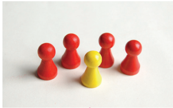
Miteinander reden und zusammen Konflikte lösen